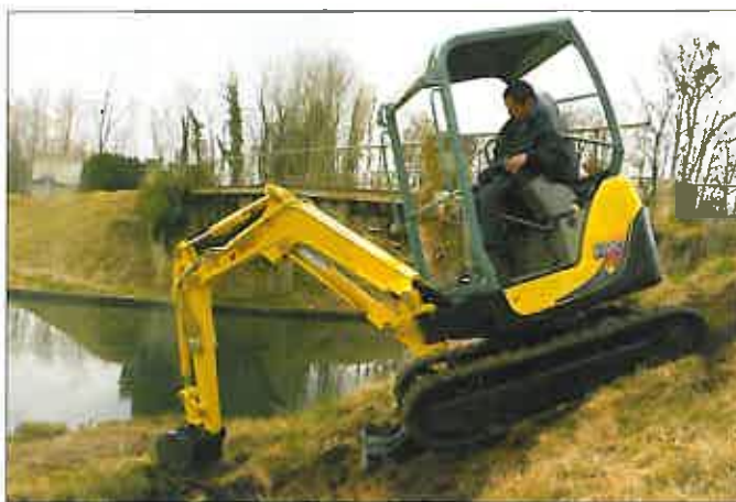
Ammann Yanmar konsekwentnie zwiększa aktywność na polskim rynku rozwijając sieć sprzedaży i serwisu swych maszyn