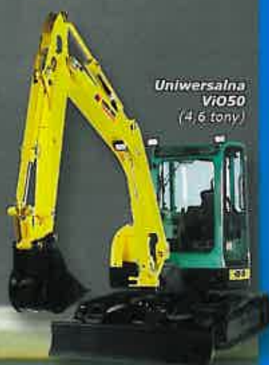
Uniwersalna ViO50 (4,6 tony)

„Idealny Zero Tail Swing” dla minikoparki poziomym